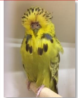
Flecky zwaar uitsluiting