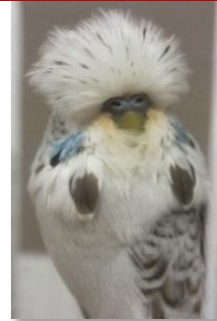
Flecky middel 3 aftrekpunten