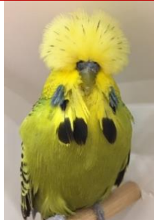
Flecky licht 1 aftrekpunt